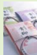
青柳茶夏パッケージ

青柳という名は、お茶の葉の形が、柳の葉に似ており、また天に昇る青龍の姿にも通じることに由来するといわれています。