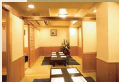
二五名様までの宴会可