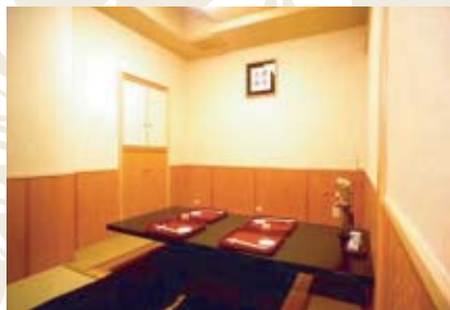
掘りこたつ形式の個室