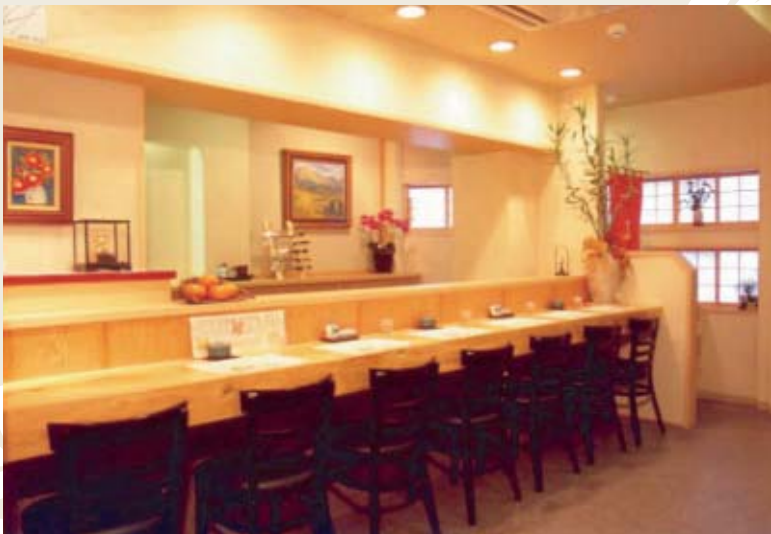
七席のカウンター