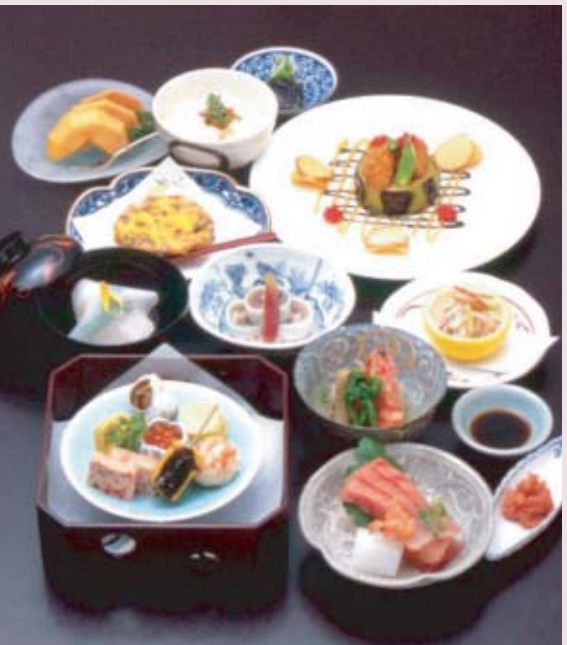
おまかせ懐石 七、〇〇〇円